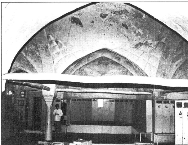
حمام گپ، خرم آباد

حمام گپ در محله بازار خرم آباد واقع شده و از خیابان مجاور