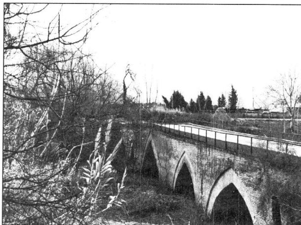
پل آزان، جویبار

این پل در روستای آزان از توابع جویبار، بر روی رودخانه