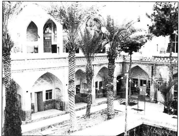
مسجد جامع بافت

استفاده طلاب علوم دینی بوده و در حقیقت صحن زیرین در حکم حوزه علمیه و یا مدرسه بوده است. از لحاظ معماری سبکی شبیه مسجد آقا بزرگ کاشان را داراست.