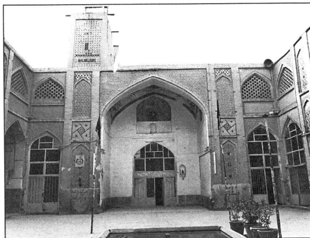
مسجد جامع خوزان - خمینی شهر

این بنا در محله قدیمی شهر، در کنار حسینیه و میدان مرکزی بافق قرار دارد و از آثار دوره قاجاریه محسوب می‌شود. مسجد بصورت دو طبقه بوده که طبقه فوقانی آن به مسجد اختصاص داشته است. ایوان مرتفع با تزئینات کاشیکاری و گنبدخانه‌ای با تزئینات بسیار زیبای آجری از ویژگیهای این مسجد به شمار می‌رود. صحن طبقه زیرین حدود ۲/۷۰ متر از کف صحن مسجد پائین‌تر است و در اطراف آن غرفاتی احداث شده که مورد