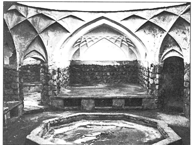
حمام گله داری، بندر عباس

حمام گله داری در محله اوزیها در ضلع غربی بازار اوزیها قرار گرفته است. این حمام متعلق به دوره قاجار و یکی از رقبه های