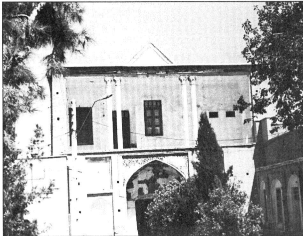
عمارت و باغ امیر، سمنان

مسجد گله داری است که توسط شیخ احمد گله داری بنیان نهاده شده است.